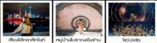
เซียงไฮ้คลาสสิกไนท์