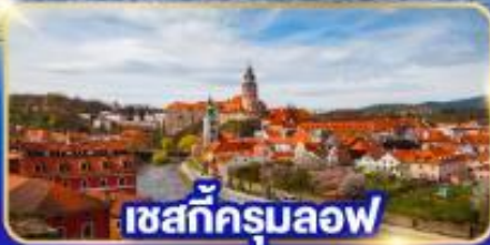
เชสกีครุมลอฟ