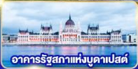
อาคารรัฐสภาแห่งบูดาเปสต์