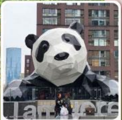
แพนด้าปิ่นตึก IFS