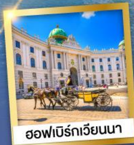
ออฟเบิร์ทเวียนนา