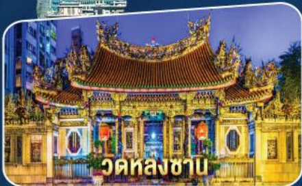
วัดหลงซา