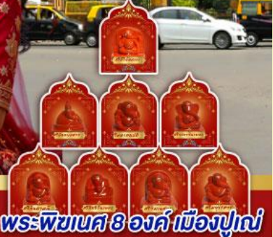
พระพิฆเนศ 8 องค์ เมืองปูणे