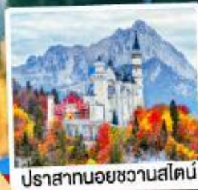
ปราสาทน้อยชวานส์ไตน์