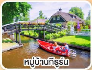
หมู่บ้านกิธูร์น