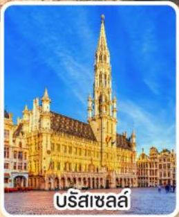
บริสซาเซล