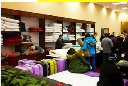
ศูนย์จำหน่ายผลิตภัณฑ์ยาวพารา