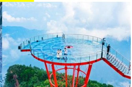
ระเบียงชมวิว Sky Eye