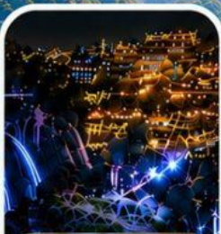
เมืองโบราณฟูหลงเจิน หมู่บ้านโบราณกลางหุบเขา