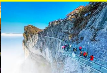
ระเบียงทางเดินกระจกเลียบนหน้าผา