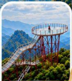
เขาเจ็ดดาว จุดชมวิวดูสุดหวาดเสียว