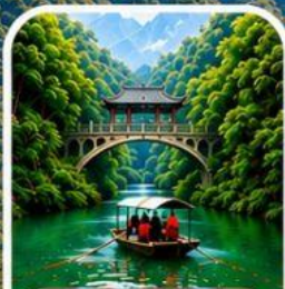
ลำธารหลงจินซี ชมธรรมชาติสุดอลังการ

ชมความงามมุมพิเศษ บุฟเฟ่ต์หมูย่างเกาหลีสุดฟิน