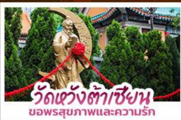
วัดหวังต้าเซียน ขอพรสุขภาพและความรัก

ขอพรเจ้าแม่กวนอิมวัดซีซ่าน ที่สูงเป็นอันดับ 2 ของโลก นั่งกระเช้าเองปีงสักการะพระใหญ่เทียนถาน • ขอพรองค์แซง โชคลาภ การเงินและธุรกิจ • ซื้อมีปิงจู่ใจย่านจิมซาจุ่ย และ CITYGATE OUTLETS