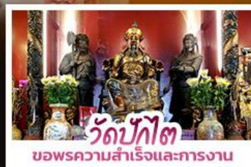
วัดบักโต ขอพรความสำเร็จและการทำงาน