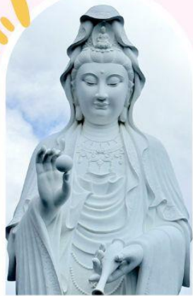
วัดเจ้าแม่กวนอิมชั๊น ความเมตตา ความสงบ สิริมงคล