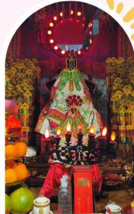
วัดเจ้าแม่กวนอิมฮ่องฮำ ขอพรเรื่องเงิน ทรัพย์สิน และความมั่งคั่ง