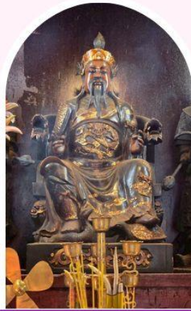
วัดปึกโต เสริมโชคลาก นำพาความรุ่งเรือง