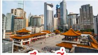
ตึกขุยซิง

พระแกะสลักหินต้าจู้ - หลุมฟ้าสะพานสวรรค์ - เขานางฟ้า ตึกขุยซิง - ตึกตะเกียบ หมู่บ้านโบราณฉือซีหัว