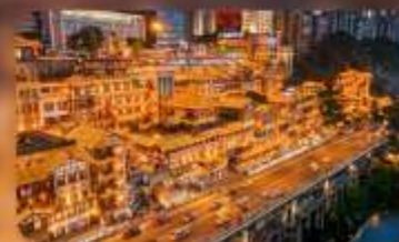
หงหย่าตั้ง