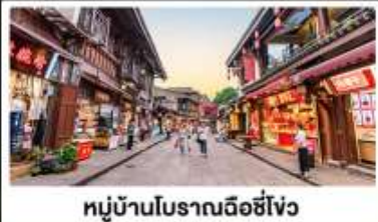
หมู่บ้านโบราณฉีซีโจว