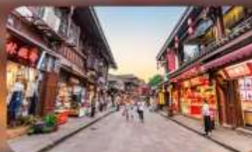
หมู่บ้านโบราณฉือซีไห่