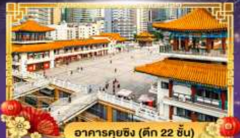
อาคารคุยฉิ่ง (ตึก 22 ชั้น)