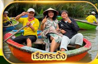
เรือกระดิ่ง