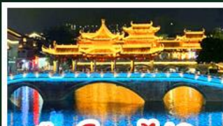
เมืองโบราณไท่ผิง