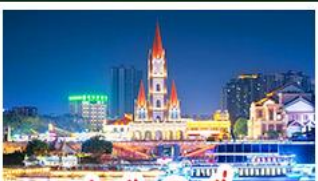
ท่าเรือกิ่งจื่อ

เขาชิงช้าสวนดอกไม้ตามฤดูกาล หมู่บ้านสไตล์ยุโรปเที่ยงยาว มังซิง เสี่ยวเจิน ถนนคนเดิน NANNING ZHIYE - เมืองโบราณไท่ผิง ท่าเรือกิ่งจื่อ - ถนนคนเดิน สามตรอกสองซอย