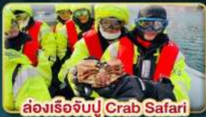
ล่องเรือจับปู Crab Safari

📅 เดินทาง: 08-16 ต.ค. | 07-15 พ.ย. 30 พ.ย. - 08 ธ.ค. 69