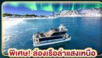
พิเศษ! ล่องเรือสำแสงเหนือ