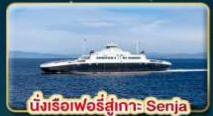
นั่งเรือเฟอร์รี่สู่เกาะ Senja