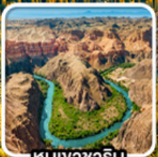
หุบเขาซาริน