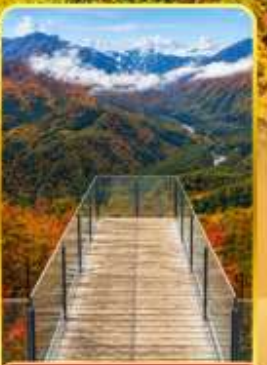
ฮาคูบะอิวาตากะ