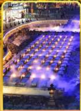
ชมอุบาคาเกะ