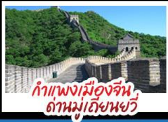
กำแพงเมืองจีน ด่านมู่เทียนยวี่

Universal Beijing - กำแพงเมืองจีนด่านมู่เทียนยวี่ (รวมกระเช้าขึ้น-ลง) พระราชวังโบราณกู้กง - หอฟ้าเทียนถาน - ซุปป์ิงกนทวิงฟูจิ่ง และซานหลี่กุน เมนูพิเศษ สุกี่มอโก, เป็ดปักกิ่ง, Michelin Guide ร้าน Tao Tao Ju