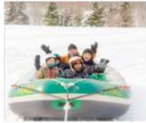
นังสโนว์ราฟติง