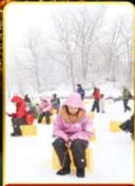
ตกปลาน้ำแข็ง