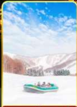
กิจกรรมโนว์ราฟติง