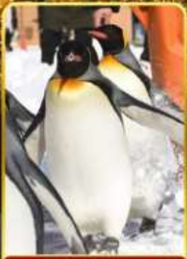
มิถุซามารีนพาร์ค