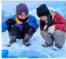
ตกปลาน้ำแข็งวากาซากิ