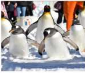
นิกเซ่มารีนพาร์ค(แพนกวิน)