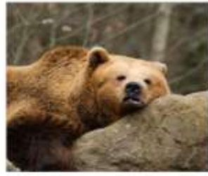
นังกระเช้าชมฟาร์มหมี