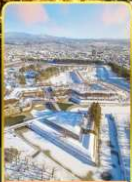
หอดาวห้าแฉก