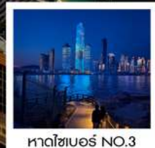
หาดไซเบอร์ NO.3

👤 กว๊านคุณธรรม ไม่หลงร้านช้อปปิ้ง ไม่ขายออฟชั่น