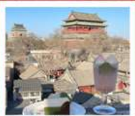
คาเฟ่ น้ำตาล