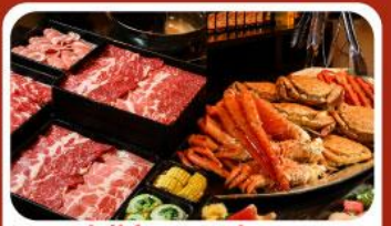
บุฟเฟ่ต์ซาบู ซาปู 3 ชนิด