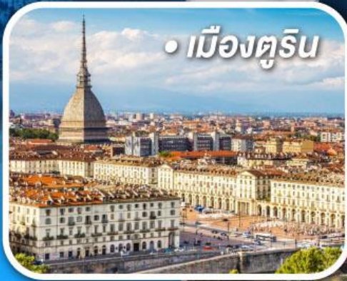
• เมืองตูริน