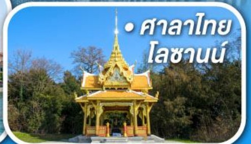
• ศาลาไทย โลซานน์

• สุดอากาศดีที่เซอร์แมท • ขึ้นกระเช้าสู่ออดจากลาเซียร์ 3000 • ชมเมืองคลาสสิกเบิร์น ลูเซิร์น ซูริก