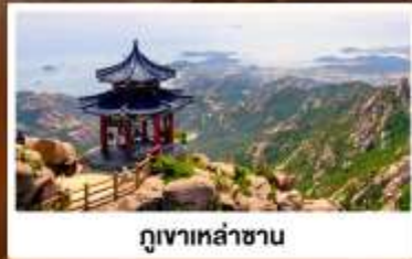
กุหาเหล่าซาน