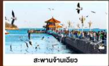
สะพานจ้านเฉียว