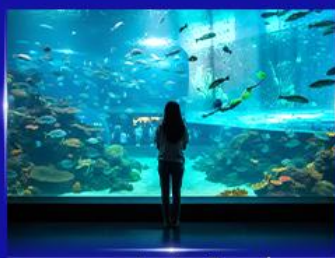
อควาเรียมยักษ์รูปเต่า