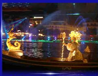
ชมโชว์เวนิสจำลอง แกรนด์วิลด์