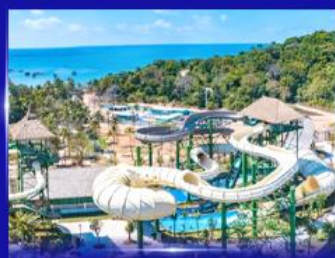
สวนสนุก Sun world Hon thom