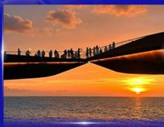
สะพานจูบ Sunset Town