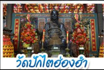
วัดบิกิตฮองฮ่า