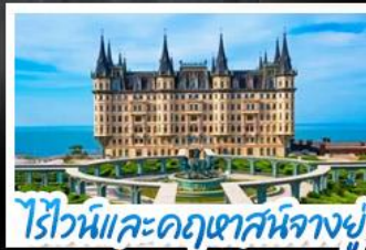
ไร่ไวน์และคฤหาสน์นางยู