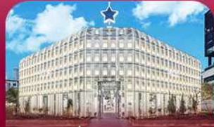
ย่านซองซู