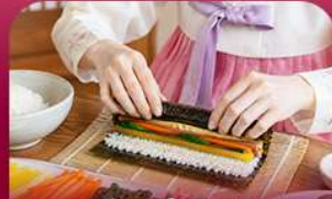
เรียงทำคิมบับ

สัมผัสเสน่ห์ฤดูหนาวของเกาหลีแบบอบอุ่นหัวใจพิเศษ! แพคเกจรีสอร์ท 1 คืน ท่ามกลางบรรยากาศที่โรแมนติก สวยงามกับกิจกรรมฤดูหนาวยอดนิยม ทั้งสกี สโนว์บอร์ดและสโนว์สเลด ก่อนออกเดินทางสู่เกาะนามิ ดินแดนแห่งความโรแมนติก ซิมสตรอว์เบอร์รี่หวานฉ่ำ สด ๆ จากฟาร์ม พร้อมเรียนทำคิมบับเมนูยอดฮิตสไตล์เกาหลี ปิดท้ายด้วยการช้อปปิ้งสินค้าเมืองคยองและซองซู ย่านอิคทึสลายคาเฟ่และสายแฟชั่นห้ามพลาด