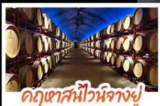
คฤหาสน์ไวน์นางยู๋