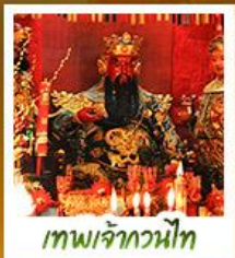
เทพเจ้ากวนไท