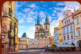
ชมย่านเมืองเก่า ปราก