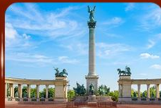
จัตุรัสวีรบุรุษ บูดาเปสต์