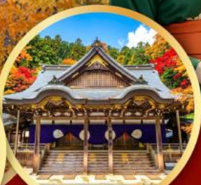
ศาลเจ้าอิสะ