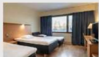
Triple สำหรับ 3 ท่าน