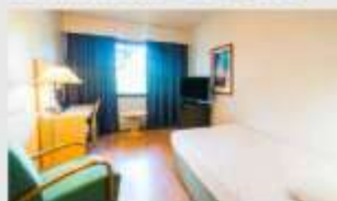
Single สำหรับ 1 ท่าน