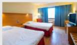
Twin สำหรับ 2 ท่าน