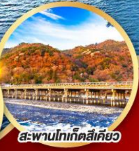
สะพานโทเก็ตสึเคียว

จัดเต็ม เทียวสวนสนุก ล่องเรือ นั่งกระเช้า ชมใบไม้เปลี่ยนสี ซอปปิงสุดมันส์ ชมใบไม้เปลี่ยนสีพร้อมวิวฟูจิ กับชมประตูโทเซกจิ แชนมอน วัดโทเซกจิ