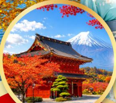
ชมประตูโทเซกจิแชนมอน วัดโทเซกจิ