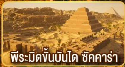
พีระมิดขั้นบันได ชัคคาร์่า