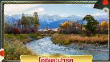
โออิเตะ-ปาร์ค