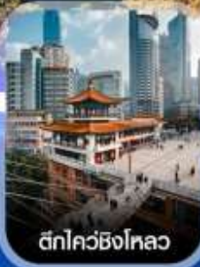
ตึกไควซิ่งไหลว

✈️ คอนเฟิร์มออกเดินทาง ทุกพีเรียด 2 ท่านขึ้นไป