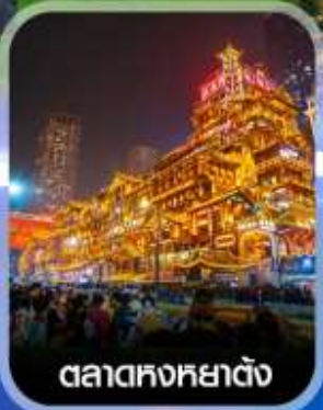
ตลาดหงหยาดตั้ง