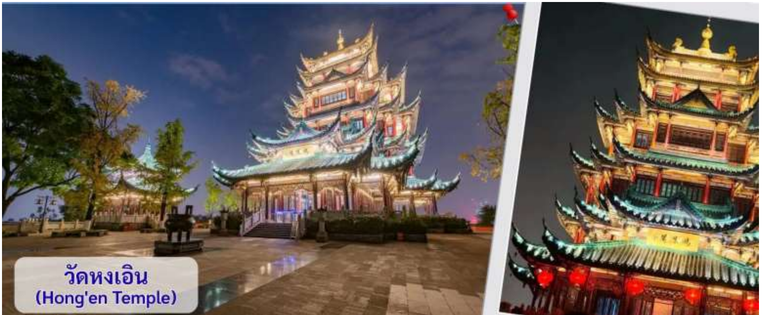
วัดหงเอิน (Hong'en Temple)

จากนั้นนำทุกท่านชม วัดหงเอิน หรือมักเรียกกันว่า วัดฮงเอิน หรือ สวนสาธารณะวัดหง เป็นหนึ่งในแลนด์มาร์กท่องเที่ยวที่สวยงามและได้รับความนิยมอย่างมาก ตั้งอยู่ในเขตเจียงเป่ย์ เมืองฉงชิ่ง จุดเด่นและไฮไลท์สำคัญของที่นี่ศาลาหรือเจดีย์หงเอิน สูง 7 ชั้นที่ตั้งอยู่บนยอดเขาหลงจี (สูงประมาณ 468 เมตรเหนือระดับน้ำทะเล) สถาปัตยกรรมเป็นสไตล์จีนโบราณดั้งเดิม หลังคามีสวดลายมังกรอย่างประณีต ตัวศาลาล้อมรอบด้วยตึกสูงระฟ้าของเมืองฉงชิ่ง ให้ความรู้สึกลike "วัดโบราณที่ซ่อนตัวอยู่ในมหานครไซเบอร์พังค์" ไฮไลท์ที่ห้ามพลาดเด็ดขาดคือ การชมวิวยามค่ำคืน เมื่อถึงเวลาเปิดไฟ (ประมาณ 18:30 - 19:30 น. เป็นต้นไป ขึ้นอยู่กับฤดูกาล) ตัวศาลาจะส่องแสงทองอร่ามตัดกับความมืดและแสงไฟของตึกระฟ้าโดยรอบ นักท่องเที่ยวนิยมใส่ชุดฮั่นฝู (Hanfu) มาเดินถ่ายรูปตามบันไดและระเบียงทางเดิน ซึ่งให้บรรยากาศคล้ายหลุดเข้าไปในอนิเมะเรื่อง Spirited Away และยังเป็นจุดชมวิวพาโนรามาที่สามารถมองเห็นแม่น้ำเจียงหลิง รวมถึงเขตหยูจางและเจียงเป่ย์ได้แบบ 360 องศา