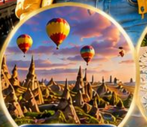
เมืองคัปปาโดเกีย Cappadocia