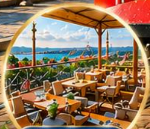
Seven Hills Cafe ชมวิว อิสตันบูล