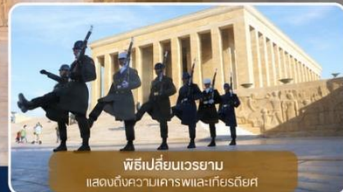
พิธีเปลี่ยนเวรยาม แสดงถึงความเคารพและเกียรติยศ