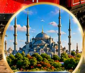
สุเหร่าสีน้ำเงิน Blue Mosque