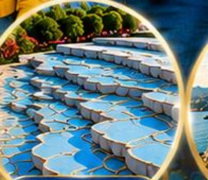
ปานุกคาล์ Pamukkale