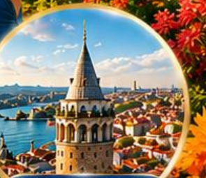
หอคอยกาลาตา Galata Tower