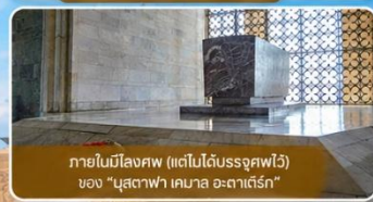
ภายในมีสิ่งศพ (แต่ไม่ได้นำบรรจุศพไว้) ของ "มุสตาฟา เคมาล อตาเติร์ก"