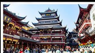
ตลาดร้อยปีเฉิงหวังเมี่ย