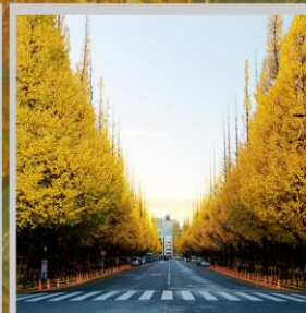
"ICHONAMIKI GINGO AVENUE"