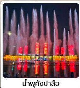
น้ำพุคังปาสือ