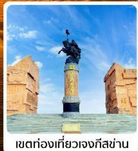
เขตท่องเที่ยวเจงกิสข่าน