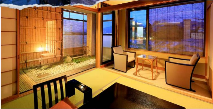
Japanese-style Room 17 sqm