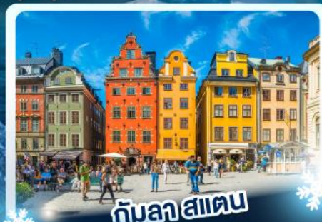
กับลาสาเตน