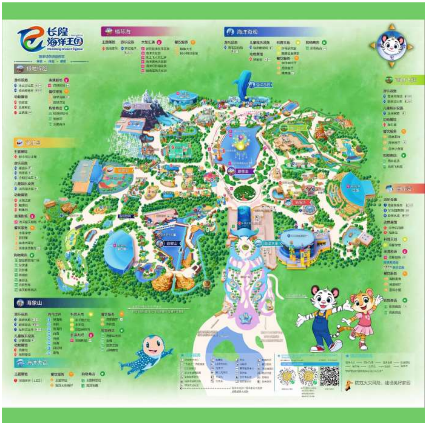
แผนที่ CHIMELONG OCEAN KINGDOM