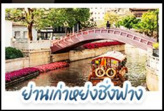
ย่านเก่าเซ่งซังฟ่าง