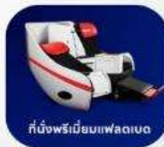
ที่นั่งพรีเมียมฟเลกซ์

บริการอาหารร้อน และ น้ำดื่ม บนเครื่องบินขาไป และ ขากลับ