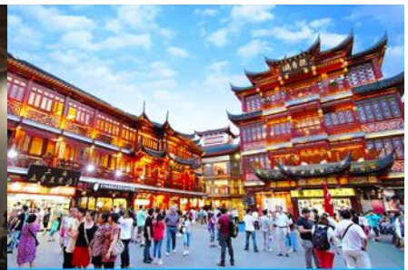
ย่านเชิงหวงเมี้ยว