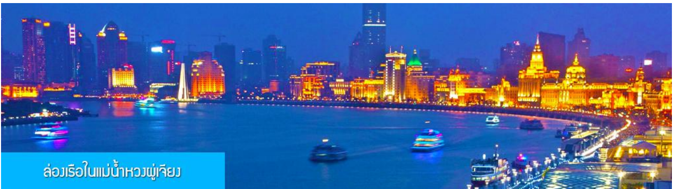
ล่องเรือใบแม่น้ำหวงผู่เจียง