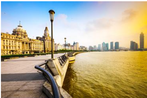
หาดไว่กาน

จากนั้นนำท่านเดินทางโดยรถบัสสู่นครเซี่ยงไฮ้ (ระยะทาง 200 กม. ใช้เวลาเดินทางราว 3 ชั่วโมงเศษ)