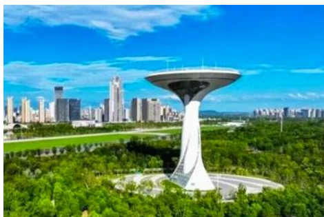
สวนสาธารณะลั่วกั๋ง

เช้า รับประทานอาหารเช้า ณ ห้องอาหารของโรงแรม (8)