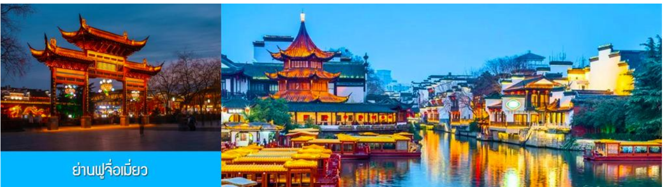
ย่านฟูจื่อเมี่ยว