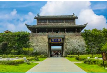
เมืองโบราณฮุยโจว

เช้า รับประทานอาหารเช้า ณ ห้องอาหารของโรงแรม (1)