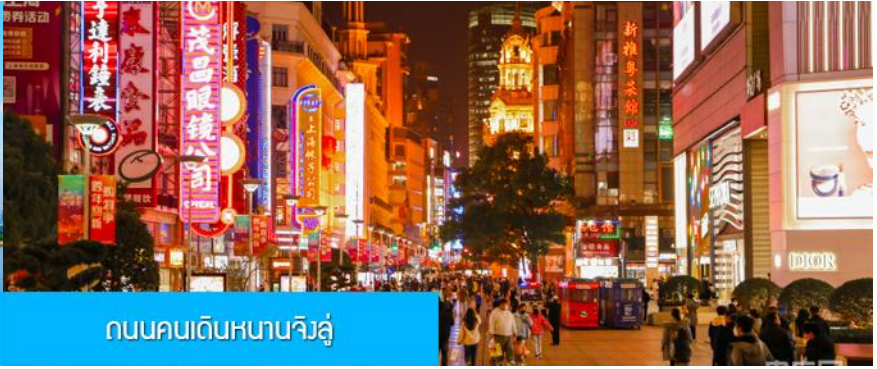
ถนนคนเดินหนานจิงลู่

จากนั้นนำท่านเดินทางสู่ ย่านช้อปปิ้งที่ใหญ่และคึกคักที่สุดของมหานครเซี่ยงไฮ้ ถนนคนเดินหนานจิงลู่ 南京路步行街 ให้ท่านเพลิดเพลินกับการเดินเที่ยว ชม และ ช้อปปิง ชิมอาหารหรือของท่านเล่นอย่างจุใจ ในย่านถนนคนเดินนี้ นอกจากร้านค้าสินค้าแบรนด์เนมจากต่างประเทศแล้ว สินค้าแฟชั่น และสินค้าแบรนด์จีนก็มีให้เลือกอย่างมากมาย ร้านอาหารและเครื่องดื่มก็มีให้เลือกนั่งเลือกชิมมากมาย..