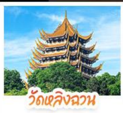
วัดเลิ่งฉวน