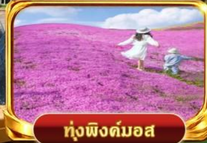
กุงฟิงคิมอส