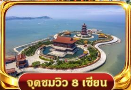
จุดชมวิว 8 เชียง