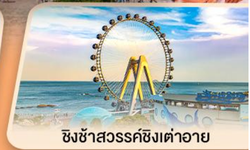
ชิงช้าสวรรค์ซิงต้าอาย