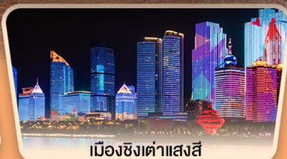
เมืองซิงต้าแสงสี