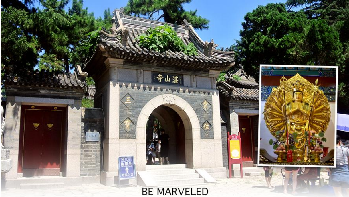
BE MARVELED วัดจันซาน

เมืองชิงเต่า สถานที่ที่สงบ และบรรยากาศภายในวัดที่ร่มรื่น ตั้งอยู่เหนือเนินเขาจากสวนสาธารณะ จงซาน ก่อตั้งในปี พ.ศ. 2477 เป็นวัดอายุน้อยที่สุดในนิกายเถียนไถของพุทธศาสนาจีน แต่โดดเด่น ด้วยสถาปัตยกรรมและคุณค่าทางวัฒนธรรม