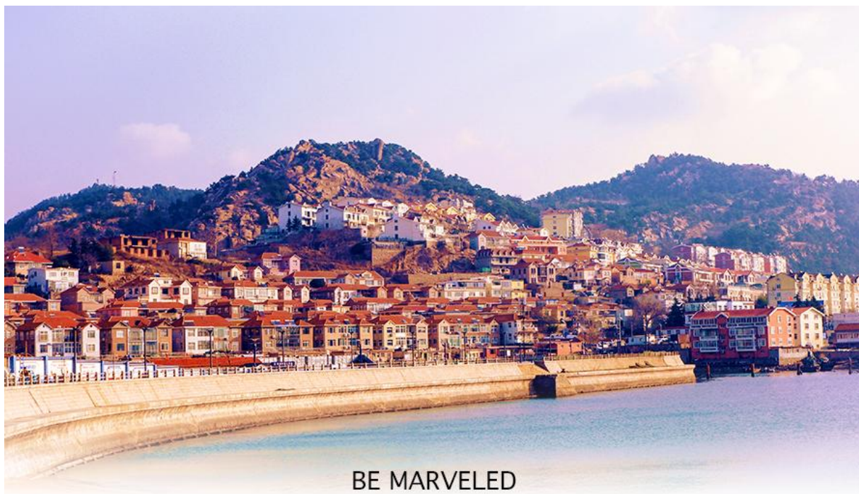
BE MARVELED ชายหาดซาจื่อโข่ว

จากนั้นนำท่านเดินไปสู่ ชายหาดซาจื่อโข่ว หมู่บ้านชาวประมงเก่าแก่ของเมืองชิงเต่า เป็นจุดเช็คอินที่มีทัศนียภาพที่สวยงามคล้ายชายฝั่ง Cinque Terre ของอิตาลี ที่มีลักษณะบ้านเรือนที่มีสีสันสดใส ตั้งอยู่บนเนินเขาตัดกับท้องทะเลสีฟ้า สถานที่ยอดเยี่ยมในการมาพักผ่อนหย่อนใจที่เมืองชิงเต่า มีทั้งสวนสาธารณะ และกิจกรรมมากมายให้ทำ