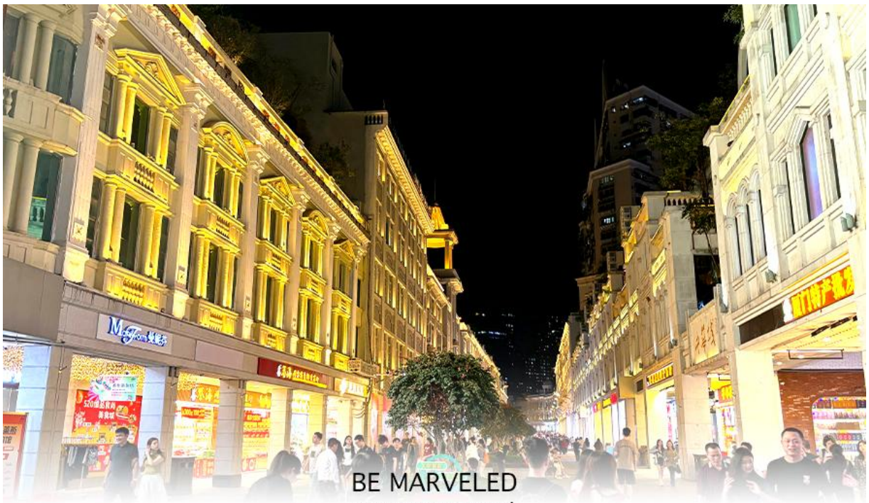
BE MARVELED ถนนคนเดินจงซานหลู่

จากนั้นนำท่านเดินทางไป ถนนคนเดินจงซานหลู่ เป็นถนนการค้าเก่าแก่ที่มีชื่อเสียง เป็นศูนย์กลางแฟชั่นและย่านช้อปปิ้งสำคัญของเมือง นอกจากนี้ ยังมี "สวนจงซาน" (Zhongshan Park) ซึ่งเป็นสวนสาธารณะขนาดใหญ่ใจกลางเมือง